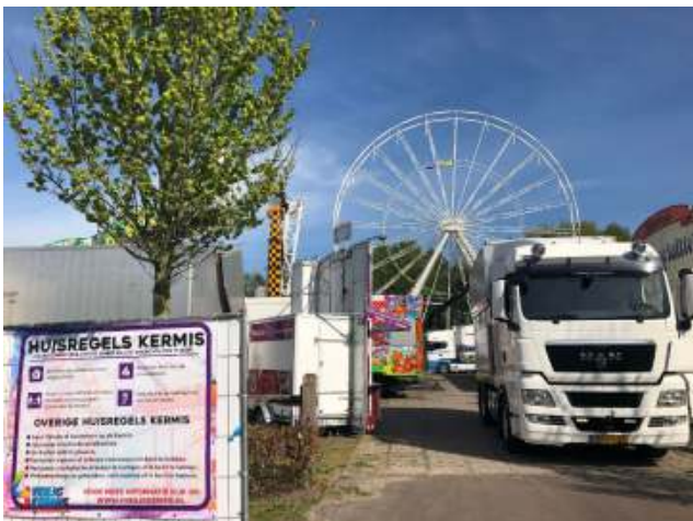
Kermis in Apeldoorn

2024 was een rustig jaar voor de CTW. Er waren niet heel veel onderwerpen die op onze weg lagen. Maar er zijn toch wel een paar doorlopende dossiers die onze aandacht blijven vragen.