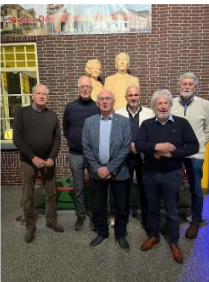
Het bestuur van de FEHAC tijdens de vrijwilligersdag in het DAF-museum

Bovenal dank aan onze leden en de vrijwilligers voor hun steun het afgelopen jaar. Samen hebben we er een succes van gemaakt. We kijken uit naar de volgende stappen in 2025.