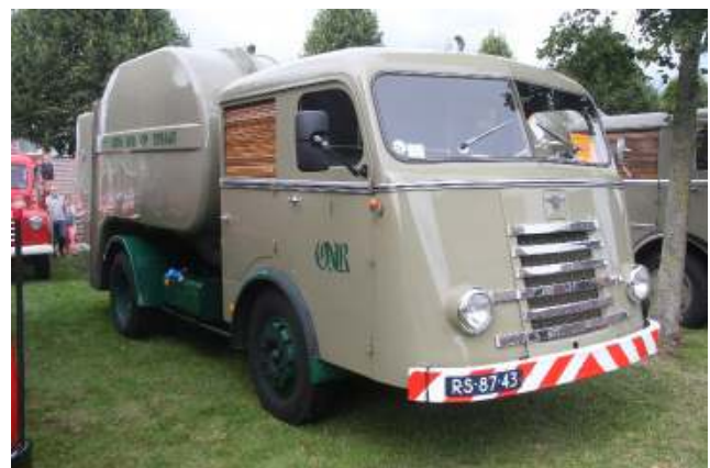
Een klassieke vuilnisauto