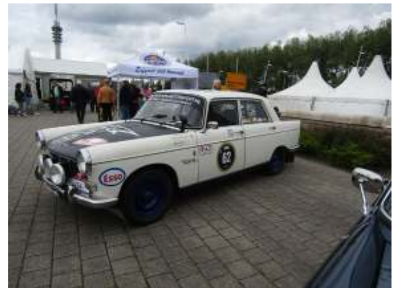
Nationale Oldtimerdag Lelystad