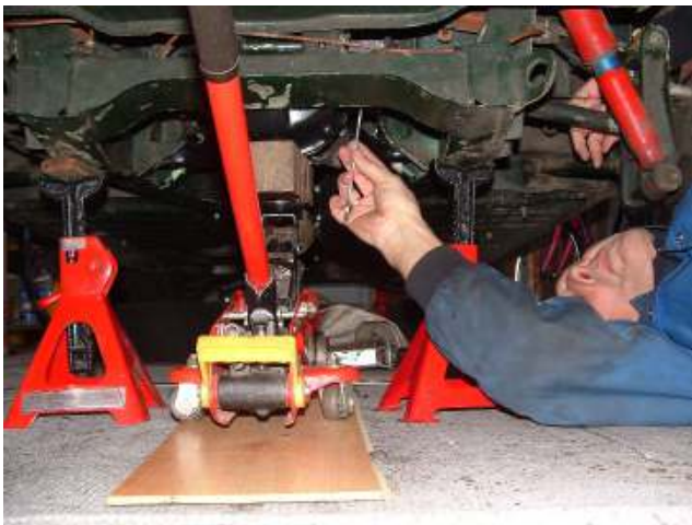
Sleutelen aan TS