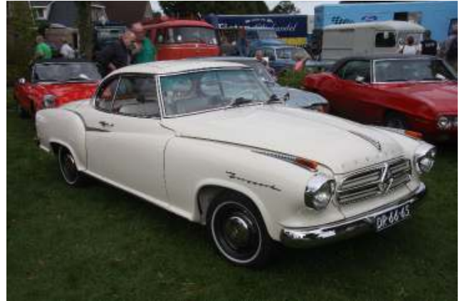
Auto's die in de folder al bijzonder waren, zijn bewaard gebleven, zoals deze Borgward Isabella Coupe