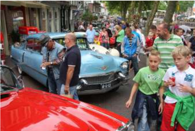
Oldtimerdagen trekken veel publiek

De FEHAC had per ultimo 2024 nog de volgende businesspartners: a.s.r. Verzekeringen; Glasurit; Ecomaxx, Louwman Museum en Motul. In de loop van 2024 heeft Ecomaxx aangegeven als businesspartner na 2024 niet te verlengen, maar wel als Vriend van de FEHAC te blijven steunen.