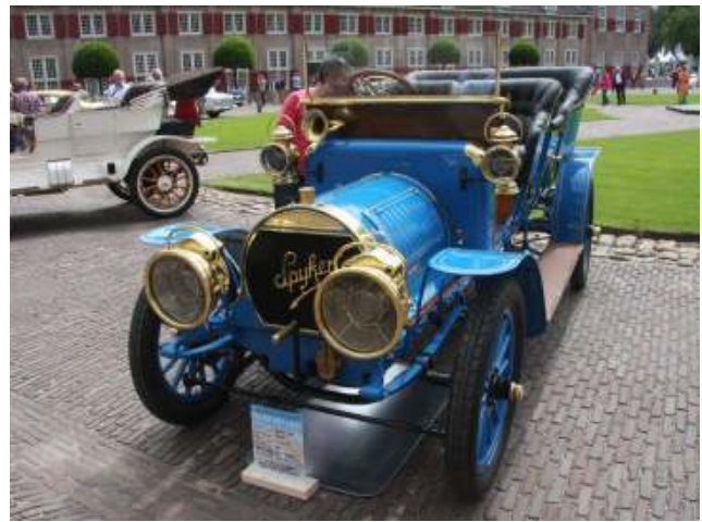
Deze Spyker uit 1906 werd als wrak gevonden in Guyana en daarna volledig gerestaureerd