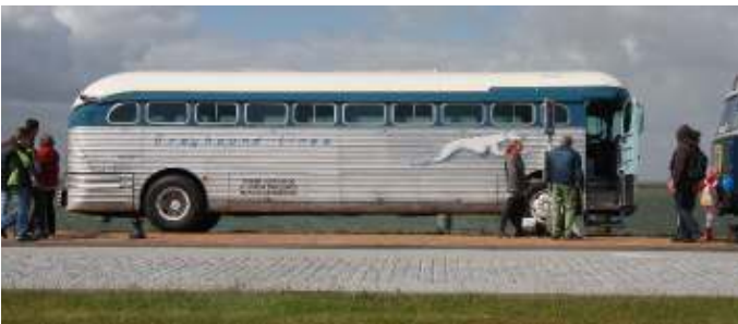
De kosten van een klassieke bus worden in de hand gehouden door hem te verhuren

Met het aantreden van het Kabinet-Schoof in juli 2024 kon het 'normale' werk voor de commissie PA weer beginnen. Nadat we eerder brieven hadden gestuurd aan de verschillende partijen, heeft de FEHAC als 'ludieke' actie aangeboden om het Kabinet per historische bus van het Haagsch Busmuseum (SVA) naar Huis ten Bosch te brengen voor hun beëdiging en het fotomoment.